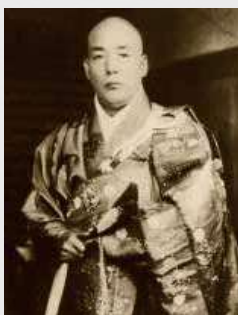
本多日生宛下。

本多日生上人(1867～1931)は、明治38年から大正15年までの21年間に亘り本宗の管長を務められるとともに、日蓮主義といわれる、日蓮大聖人(立正大師)の教義を信仰のみならず生活意識までに及ぼし、現実の社会活動を展開しようとする運動を、本宗はもとより一般社会にまで広く普及された方です。