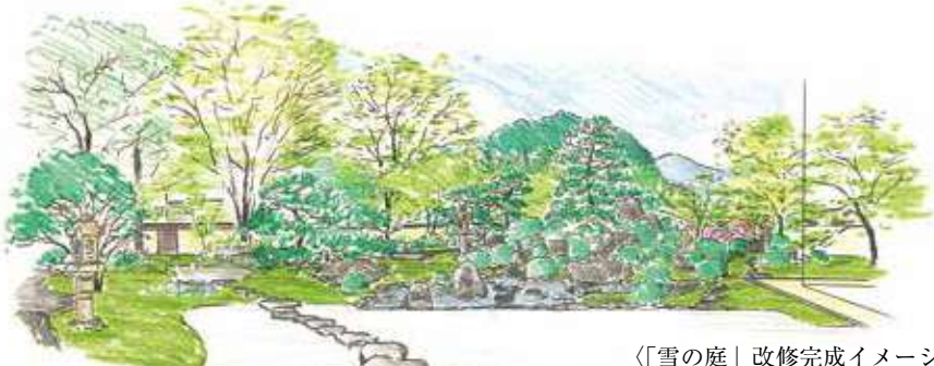
「雪の庭」改修完成イメージ

これらを解消する第1期工事は、本年1月から3月中旬までの予定で、この間、拝観は可能です。工事の様子には、本公式SNSでご覧いただけます。